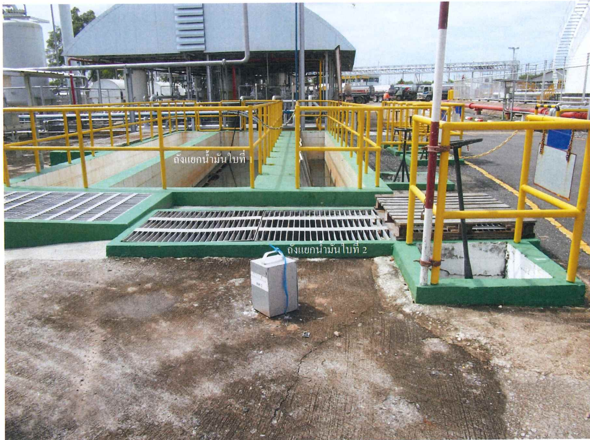
รูปถ่ายที่ 2 ถังแยกน้ำมันใบที่ 2 แบบทั่วไป