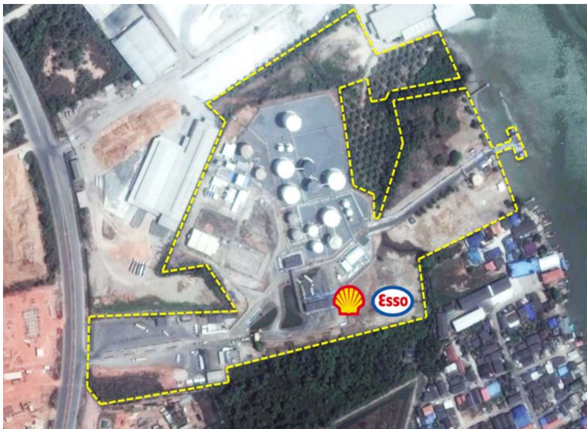
รูปที่ 1 แสดงแนวเขตคลังน้ำมันเชลล์บ้านดอน สุราษฎร์ธานี และถังแยกน้ำมัน

แสดงภาพถ่ายทางอากาศจากเว็บไซต์กูเกิลเอิร์ธของคลังน้ำมันเชลล์บ้านดอน สุราษฎร์ธานี และตำแหน่งถังแยกน้ำมันทั้ง 3 ถัง