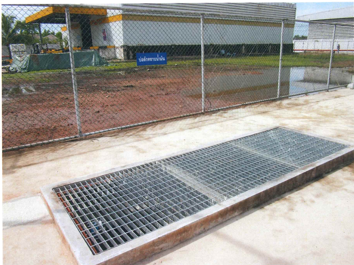
รูปถ่ายที่ 3 ถังแยกน้ำมันใบที่ 3 แบบทั่วไป